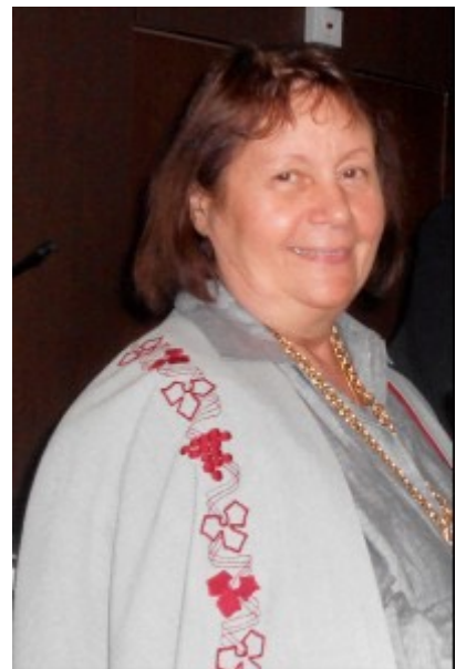
Monique JOSSE (France)

Président de la F.I.C.B. de 1984 à 2014- Président d'Honneur depuis 2015