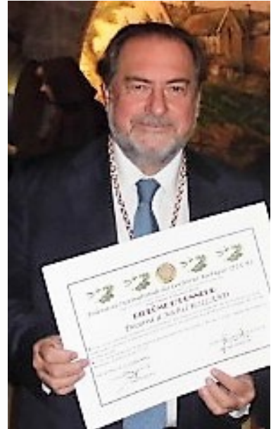
Michel ROLLAND (France) Œnologue et producteur

Proposé par le Conseil des Echantons de France